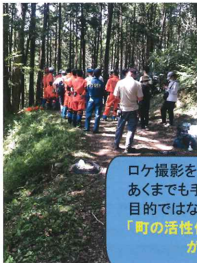
←TOKYO MER 撮影風景

(1),(3)に加えて、令和2年度より観光協会による一元的な相談窓口（ワンストップサービス）を実施し、これまで一定以上の実績を上げることができました。